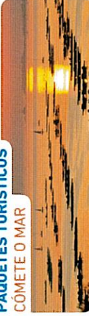
CÓMETE O MAR